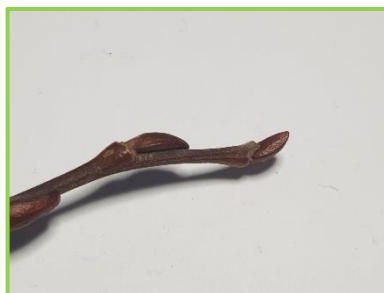
6 LINDE (hier Sommerlinde)