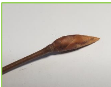
8 PAPPEL (hier Pyramidenpappel)